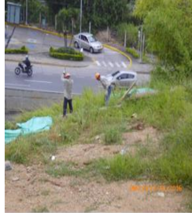
Actividades de cerramiento.