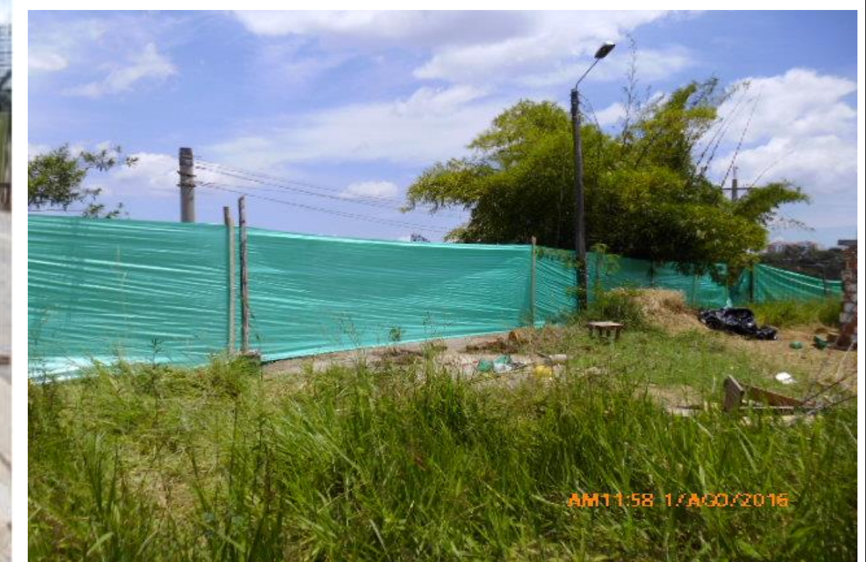
Vista al costado oriental de la edificación