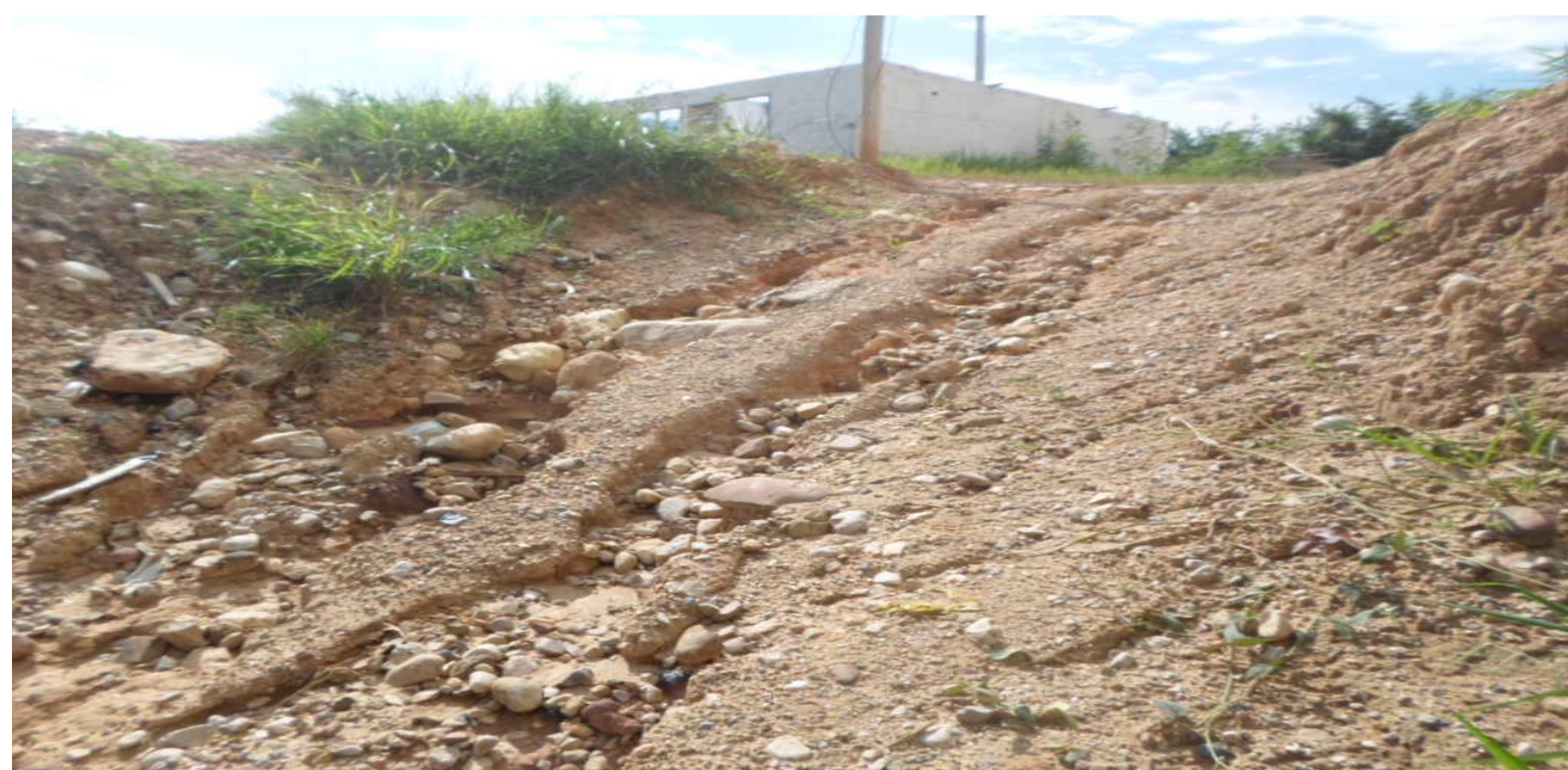
Falta acondicionamiento vía de acceso peatonal