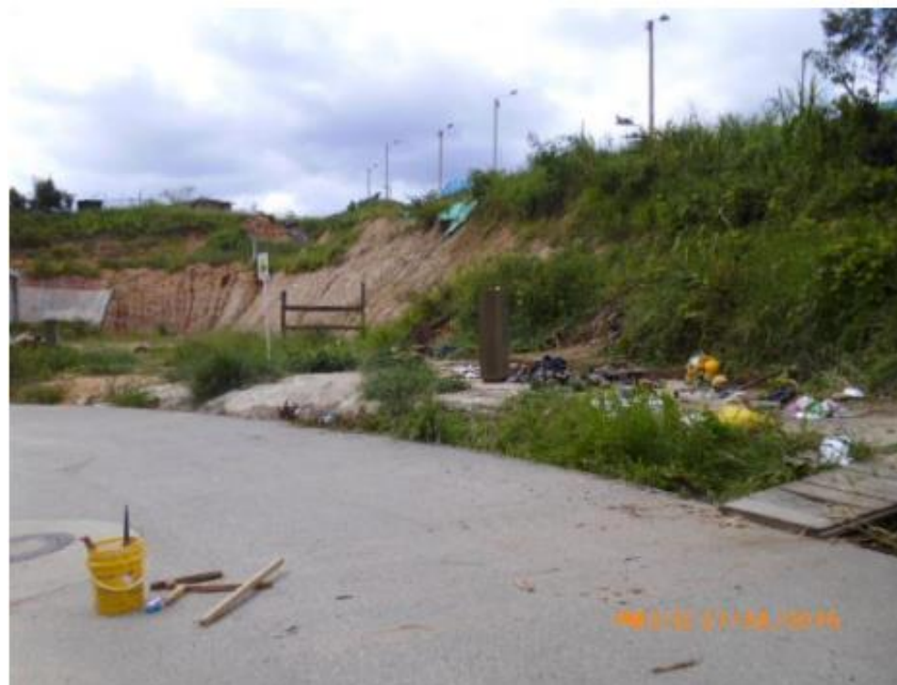
Desmonte de campamento existente -costado oriental /Julio 18-2016