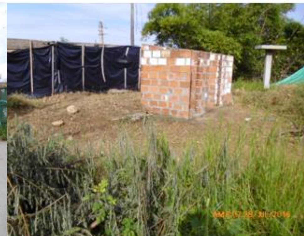
Acondicionamiento áreas de campamento