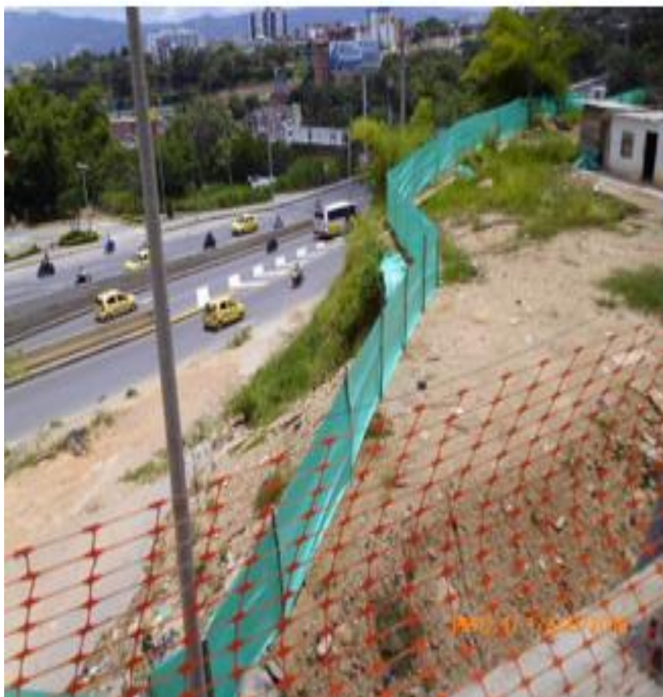
Avance instalación de cerramiento (vista occidente).