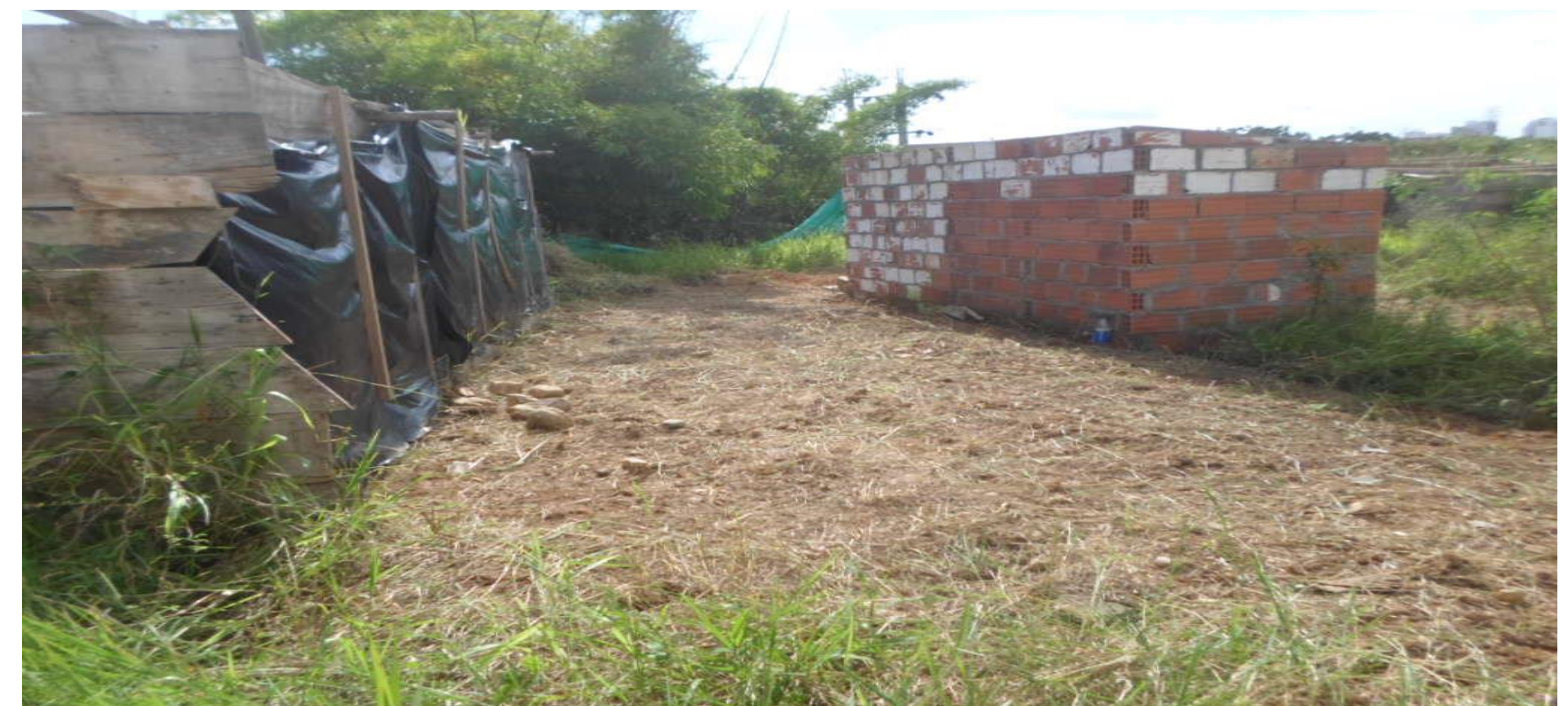
Se observa avance actividad de descapote de material