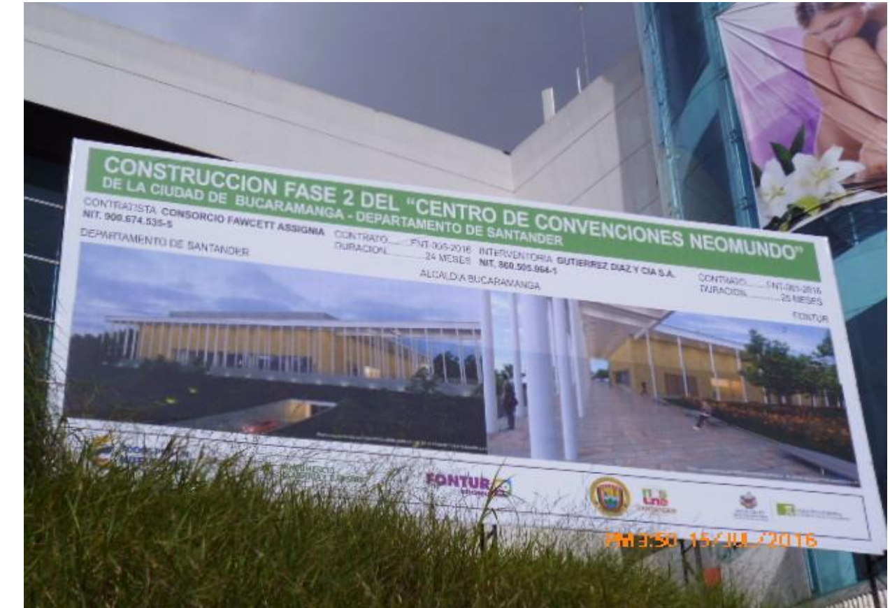
Instalación de la valla Informativa del proyecto

2.2. NOTA: Se dio inicio a la ejecución de las actividades de obra con las actividades correspondiente a los preliminares, desmonte de campamento existente, acondicionamiento de las áreas de campamento, limpieza, adecuar cerramiento..