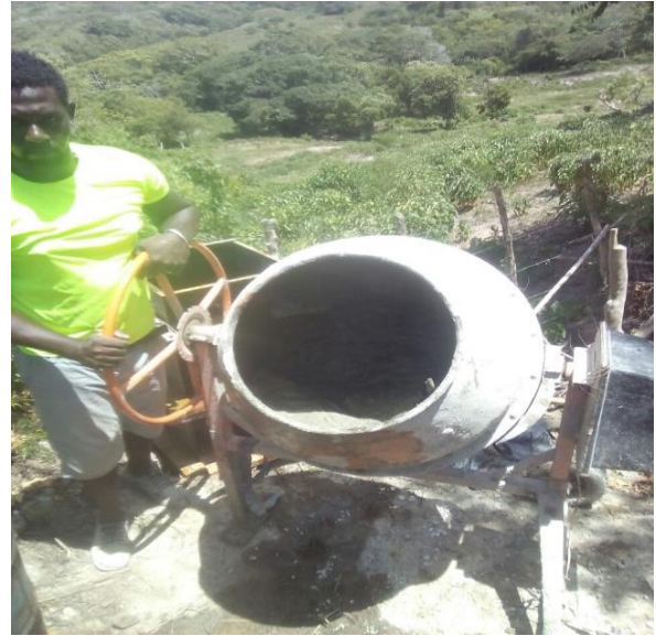
F-5 Fundida pedestales k1-400