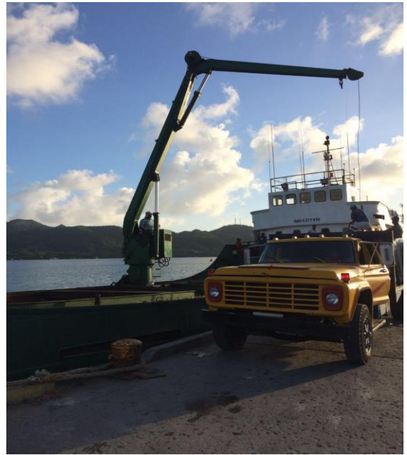
F-9 Llegada de la madera a la Isla de Providencia