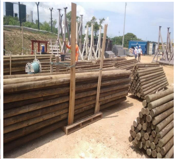
Llegada de madera a puerto