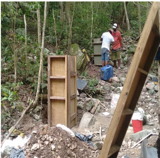
F-3 Formaleta pedestales k1-400