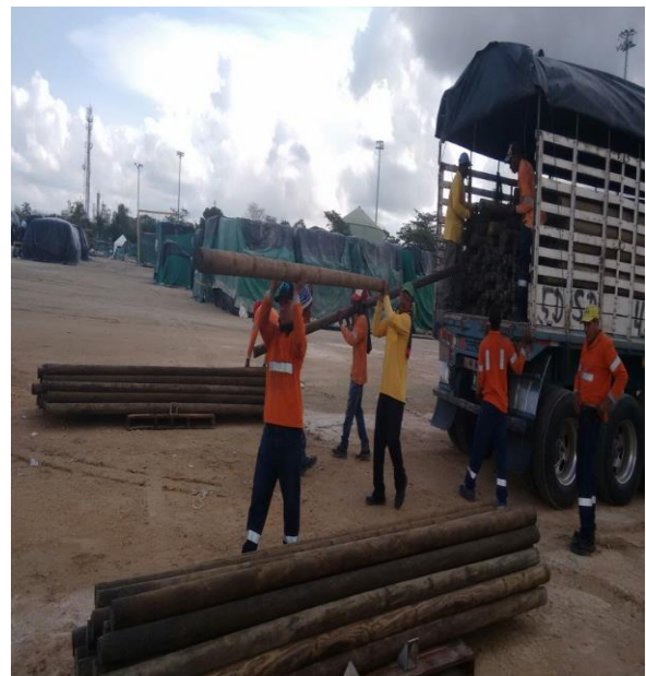
F-6 Const de filtro entre K1-160 y k1-400 F-7 Llegada de madera a puerto