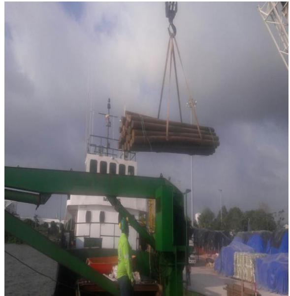
F-8 Embarque de madera en puerto