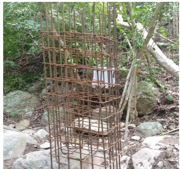
F-4 Acero de refuerzo pedestales k1-400