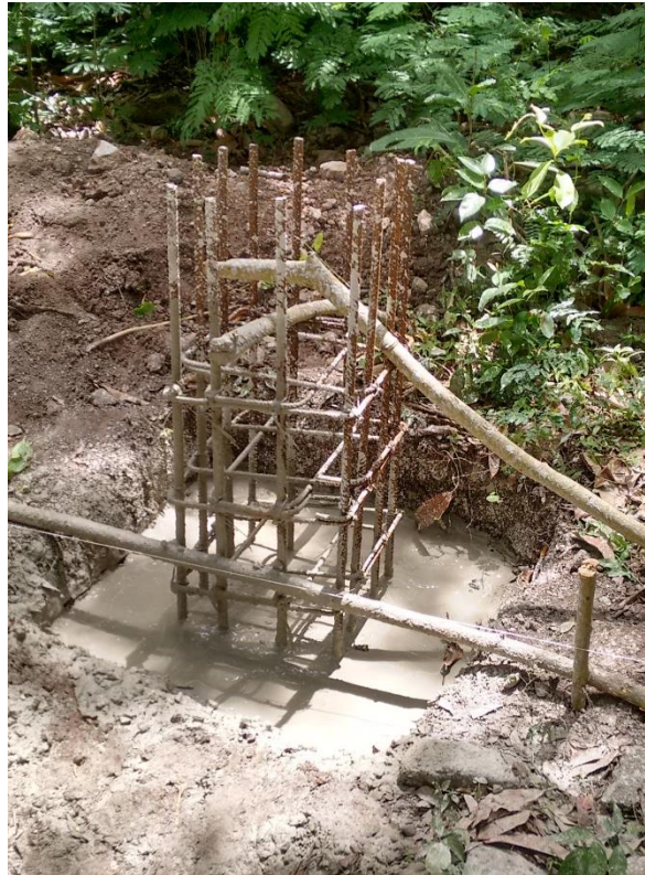
Fig 4 Fundida base pedestales k0-910 y k1-160

CALLE 7 B No. 46-43, VILLAVICENCIO (META). TEL.: 321 358 8054