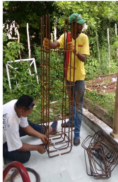
Fig 3 Corte y figuración de acero