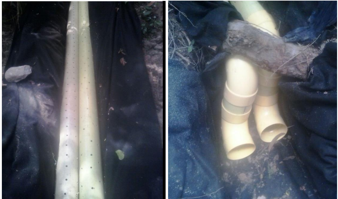
Fig 7 Construcción de filtro entre K1-160 y K1-400

CALLE 7 B No. 46-43, VILLAVICENCIO (META). TEL.: 321 358 8054