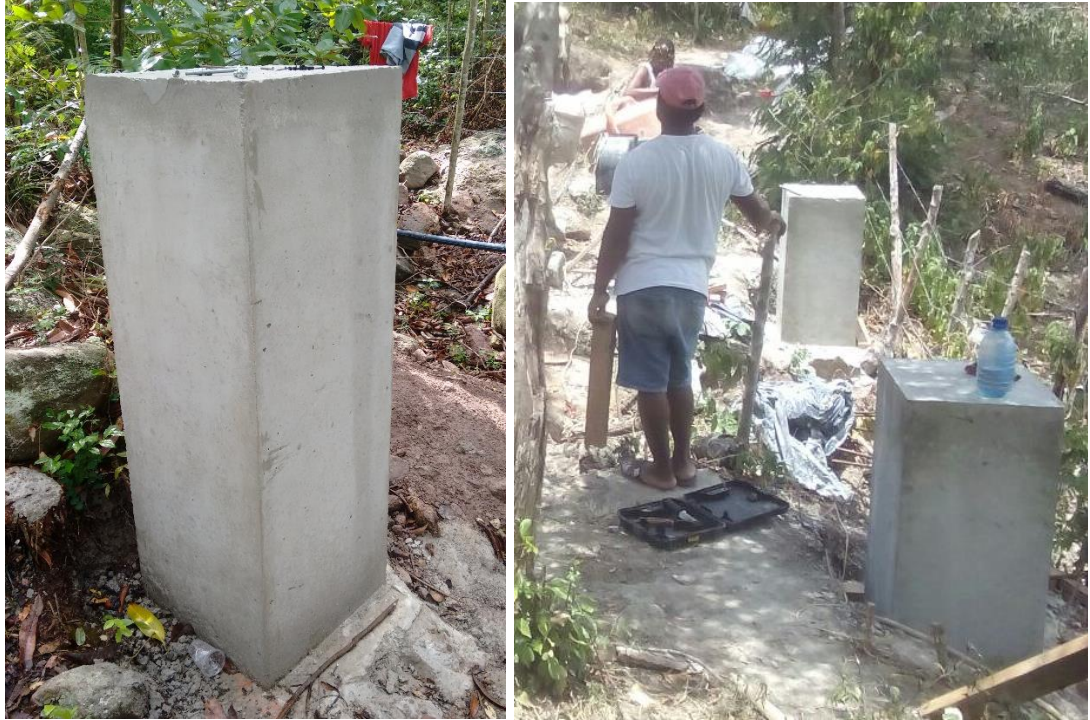
Fig 6 Pedestales puente en K1-160