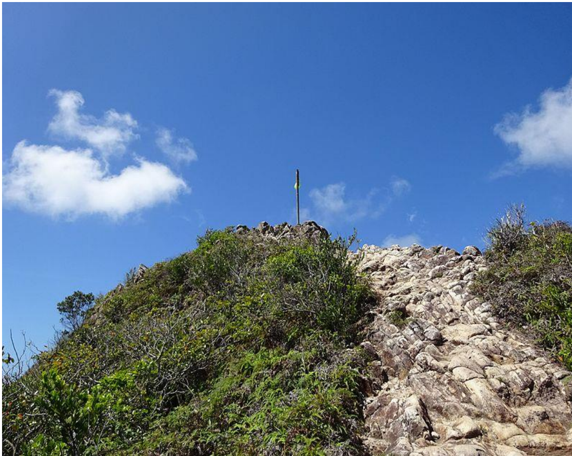
FIG 2 CERRO EL PICO SANTA CATALINA