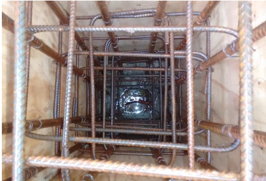
Fig 5 Formaletas pedestales